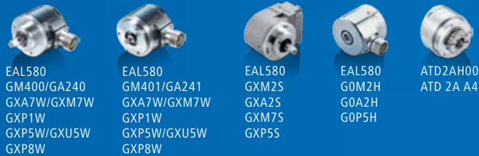
EAL580 GM400/GA240 GXA7W/GXM7W GXP1W GXP5W/GXU5W GXP8W EAL580 GM401/GA241 GXA7W/GXM7W GXP1W GXP5W/GXU5W GXP8W EAL580 GXM2S GXA2S GXM7S GXP5S EAL580 GOM2H G0A2H G0P5H ATD2AH00 ATD 2A A4