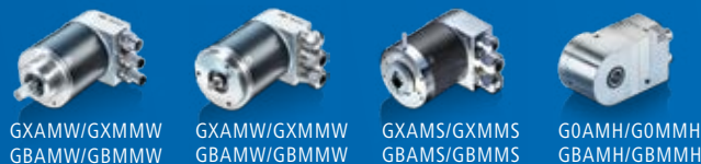
GXAMW/GXMMW GBAMW/GBMMW GXAMS/GXMMS GBAMS/GBMMS G0AMH/G0MMH GBAMH/GBMMH

Precise optical sensing – integrated interface – resolution up to 18 bit