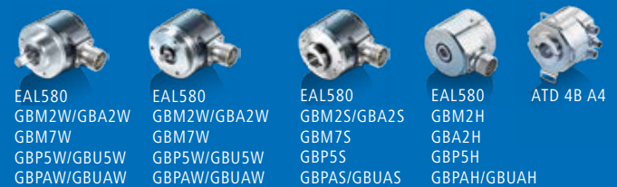
EAL580 GBM2W/GBA2W GBM7W GBP5W/GBU5W GBPAW/GBUAW EAL580 GBM2W/GBA2W GBM7W GBP5W/GBU5W GBPAW/GBUAW EAL580 GBM2S/GBA2S GBM7S GBP5S GBPAS/GBUAS EAL580 GBM2H GBA2H GBP5H GBPAH/GBUAH ATD 4B A4