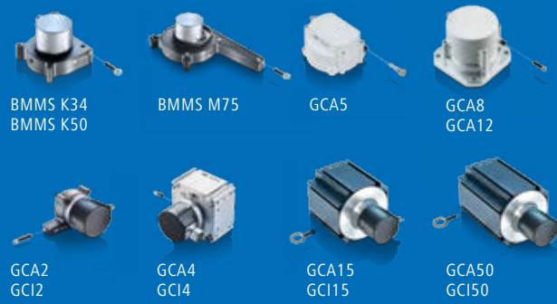
BMMS K34 BMMS K50