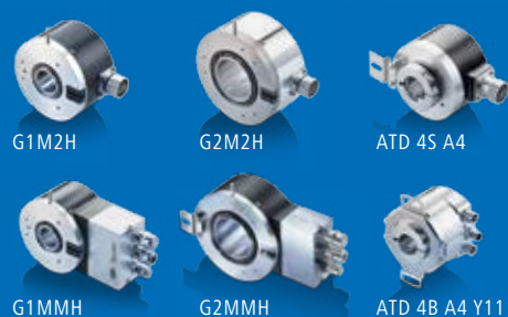
G1M2H G2M2H ATD 4S A4 G1MMH G2MMH ATD 4B A4 Y11